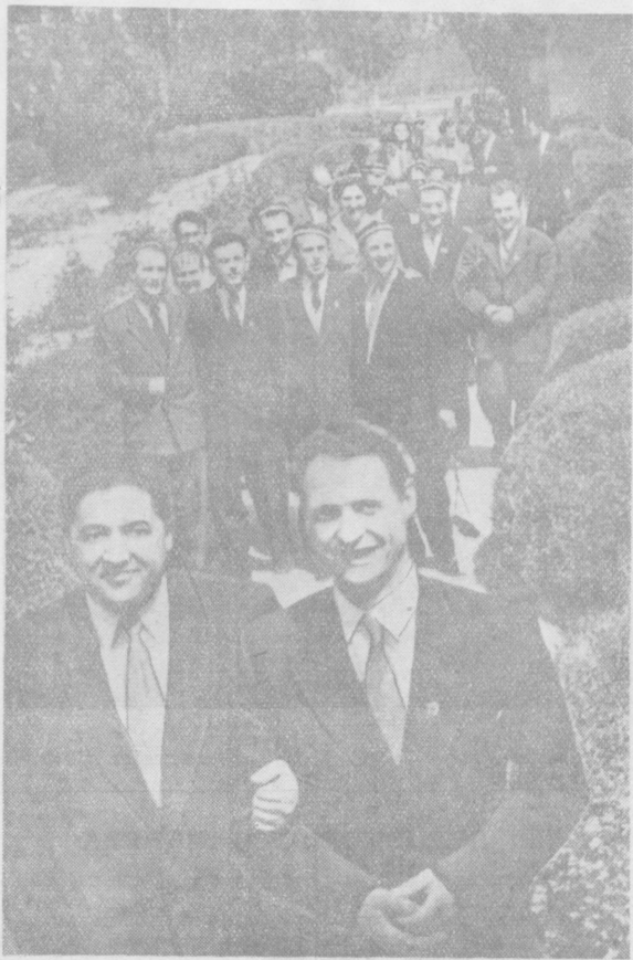
Крепко, навсегда подружился посланцы юности многих стран мира с молодежью Узбекистана.