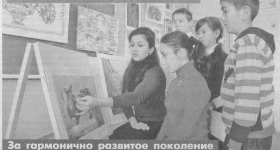
За гармонично развитое поколение