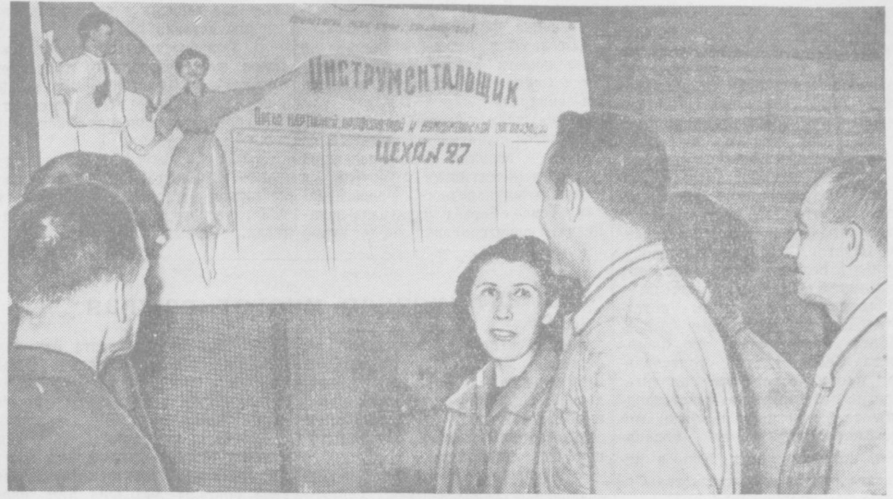
На снимке: у свежего номера стенной газеты инструментального цеха завода «Ташсельмаш» имени Ворошилова.