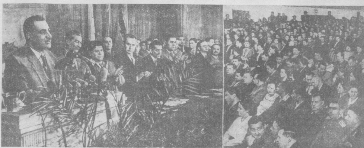
На снимке: Президент Объединенной Арабской Республики Гамаль Абдель Насер выступает на митинге, посвященном его приезду.