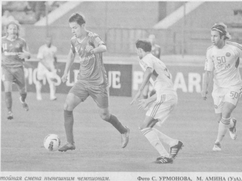
Подрастает достойная смена нынешним чемпионам.