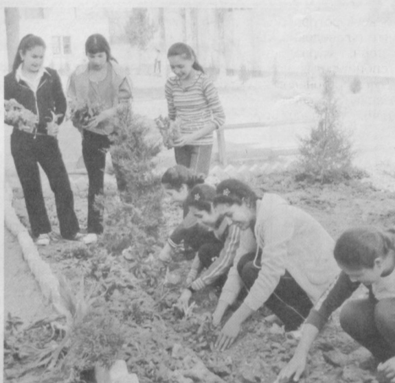
Молодежь принимает активное участие в благоустройстве города.