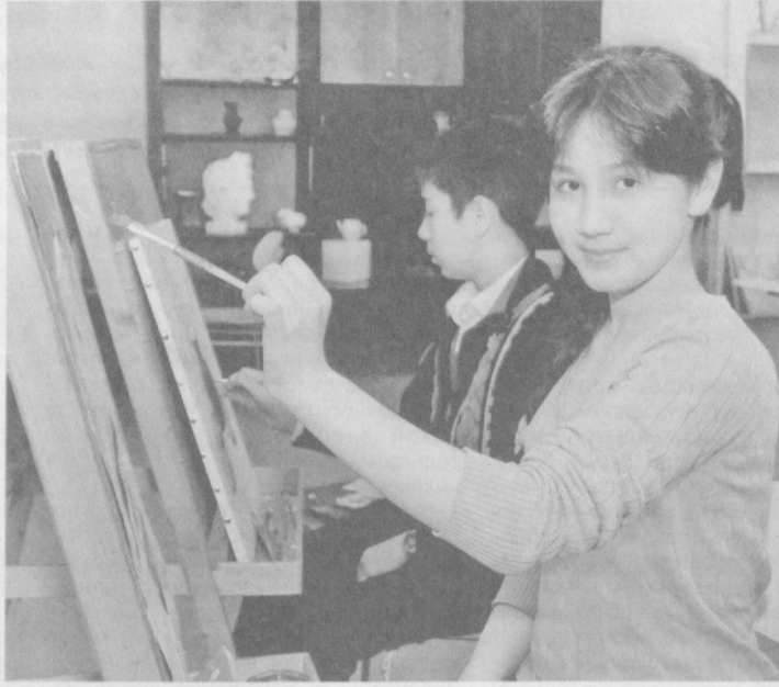
Искусство воспитывает личность.