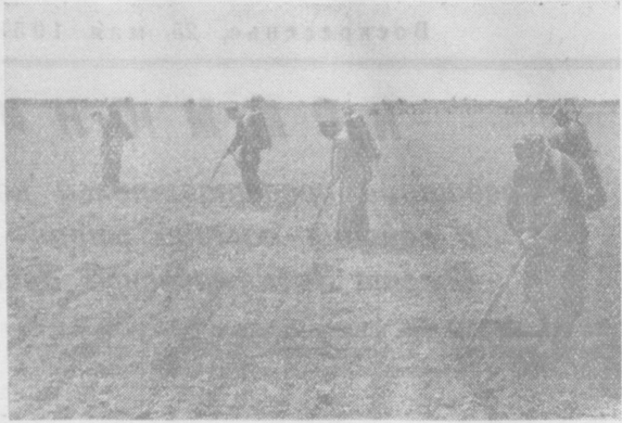
Анжнанская область. Колхоз имени Энгельса, Ленинского района, засеял в этом году хлопчатником 1410 гектаров, из них 1300 квадратно-гнездовым методом. Члены сельхозартели развернули борьбу за получение 40-центнерового урожая хлопка. Хлопкоробы проводят культивацию растений с одновременным внесением удобрений, букетировку хлопчатника, ведут борьбу с сельскохозяйственными вредителями. На снимке: отряд борьбистов колхоза имени Энгельса за обработкой хлопчатника.