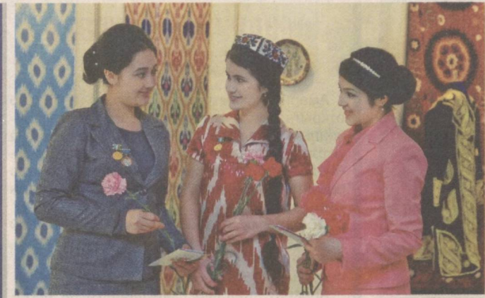
Молодые, красивые, талантливые...