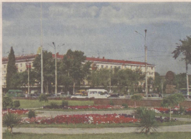
Мой любимый город.

Под руководством Президента нашей страны проводится широкомасштабная работа по охране природы, уникальных видов растений и животных, минимизации причиняемого ущерба окружающей среде, расширению лесов. Это можно увидеть на примере Угам-Чаткальского государственного национального природного парка.