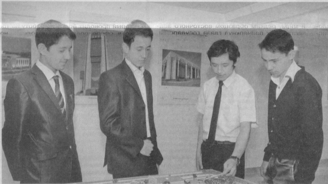
Молодежь планирует сделать наш город еще краше.

С интересом молодежь играла в традиционные народные игры «Пять камней», «Чиллик». Многие получили памятные призы и почетные грамоты.