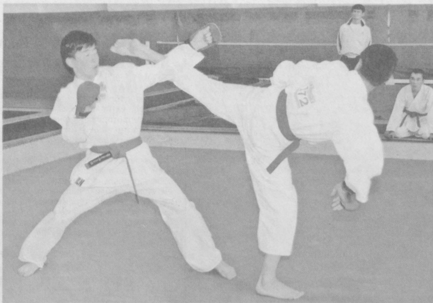
Победа приходит к настойчивым.