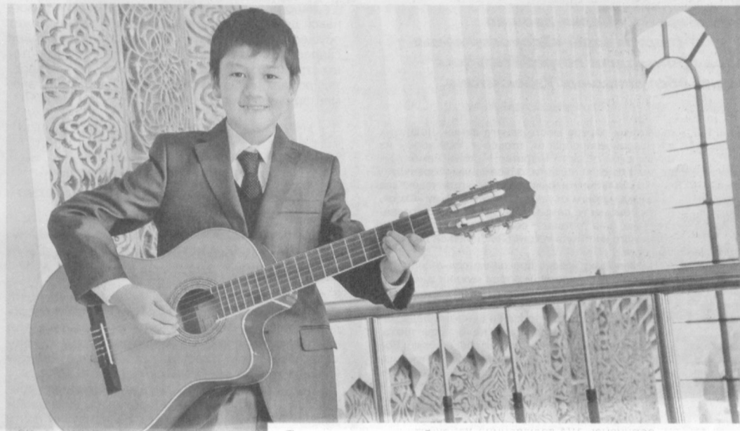
Струна звенит – душа поет...