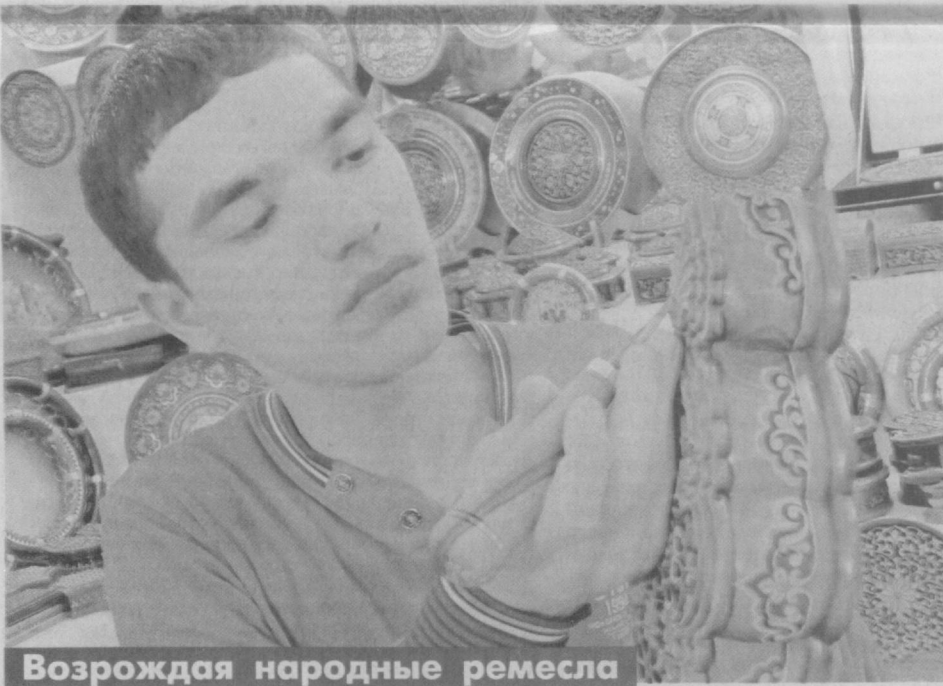
Возрождая народные ремесла

Тот, кто хоть раз сталкивался с искусством резьбы по дереву, никогда не забудет великолепных неповторимых узоров, затейливых орнаментов. Каждое из них — особый рассказ, который долго и тщательно продумывает его автор — резчик по дереву.