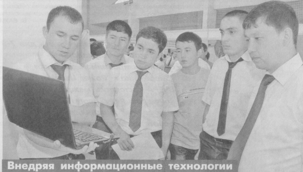
Внедряя информационные технологии