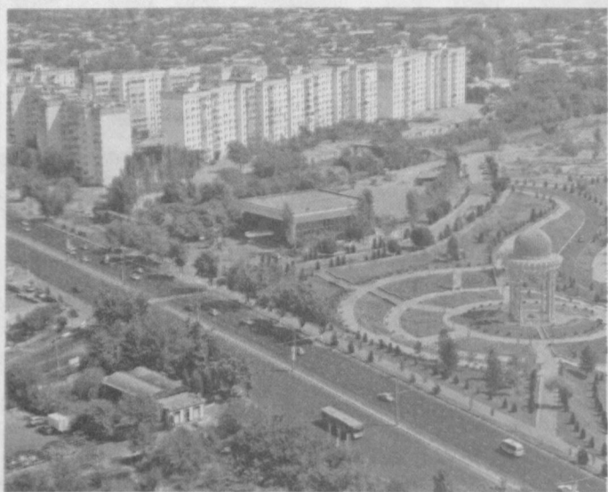
Ташкент с высоты птичьего полета.