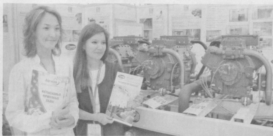
С каждым годом увеличивается спрос на продукцию фирмы «Agrotek», специализирующейся на разработке и внедрении техники и оборудования для агропромышленного комплекса.

Собственно продажа новых отечественных легковых автомобилей осуществляется только официальными дилерами, являющимися юридическими лицами и заключившими соответствующие соглашения с предприятиями-производителями, пояснили в юридическом