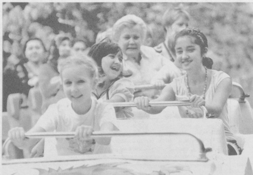
Каникулы — веселая пора.

Спортсмены нашей страны активно готовятся к XXX летним Олимпийским играм, которые пройдут в столице Великобритании Лондоне 27 июля — 12 августа 2012 года.