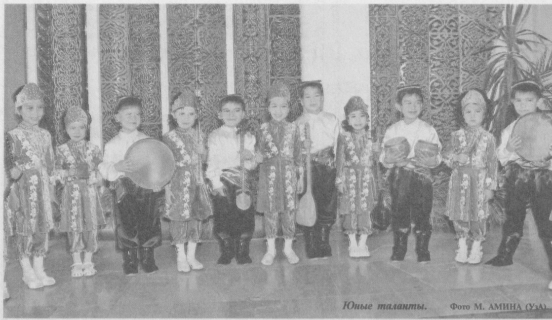
Юные таланты.

Вновь порадовал слушателей Государственный ансамбль камерной музыки «Солисты Узбекистана». Его концерт состоялся в Большом зале консерватории.