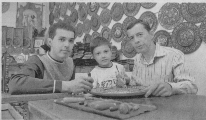
Ремесленничество — занятие семейное.