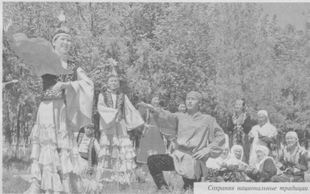
Сохраняя национальные традиции.

Наверное, о том, какой большой вклад в развитие, сохранение, обогащение каждой национальной культуры, успешно развивающейся на земле многонационального Узбекистана, вносят музыка, кино, театр, живопись, можно говорить не раз, открывая новые и новые грани этого процесса.