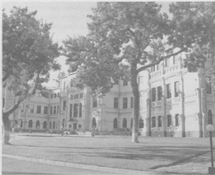
Столица в лучах солнца.