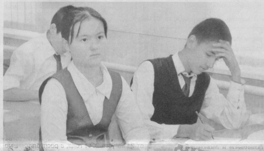
Еще вчера – выпускники школы, а уже сегодня – абитуриенты колледжа.