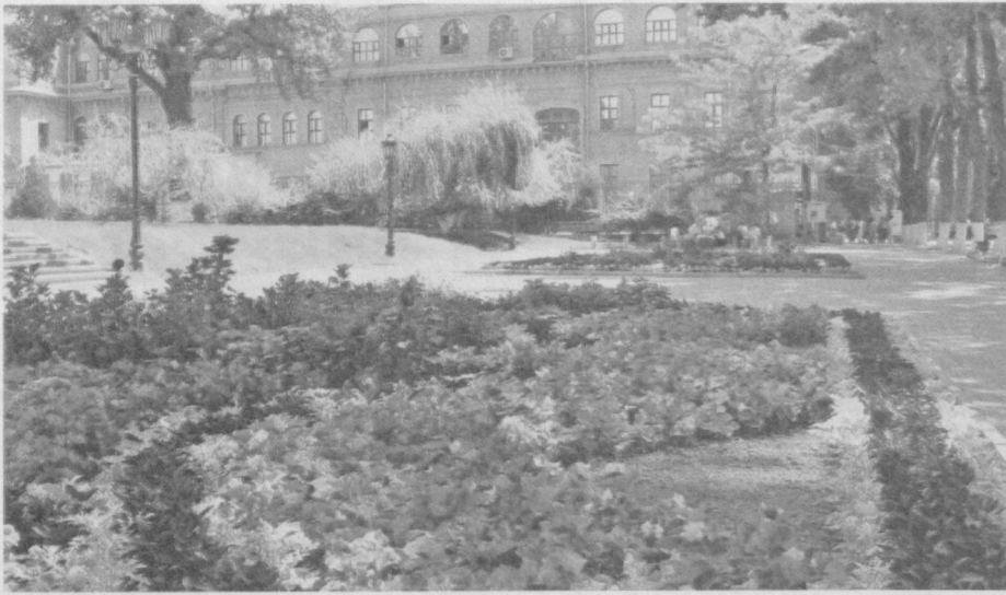
Зеленый наряд нашей столицы не только радует глаз, но и создает прохладу, очищает воздух от загрязнений, предохраняет жилые кварталы от шума машин.