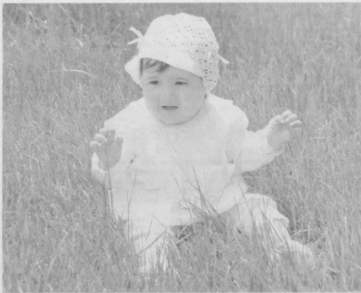
Счастлиное детство, согретое лучами солнца.

Объявление в лице приглашало всех неравнодушных к природе принять участие в съемках фильма. Я не сомневалась ни секунды. Природу люблю, в съемках еще ни разу не участвовала, тем более интересно! Словом, решила прийти на отборочный конкурс. Он состоял из двух этапов.