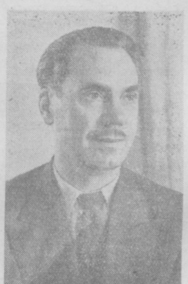
Артур Лундквист, писатель (Швеция).