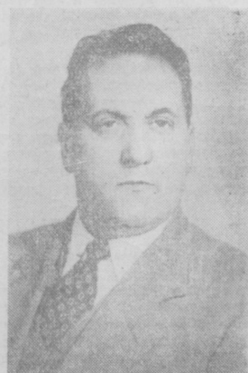
Луи Сайян, генеральный секретарь Всемирной федерации профсоюзов.