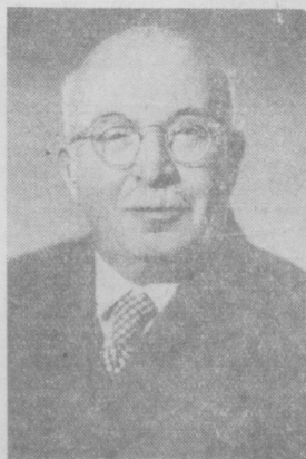
Арнольд Цейг, писатель (Германская Демократическая Республика).