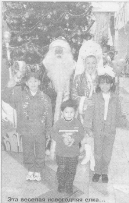
Эта веселая новогодняя елка...