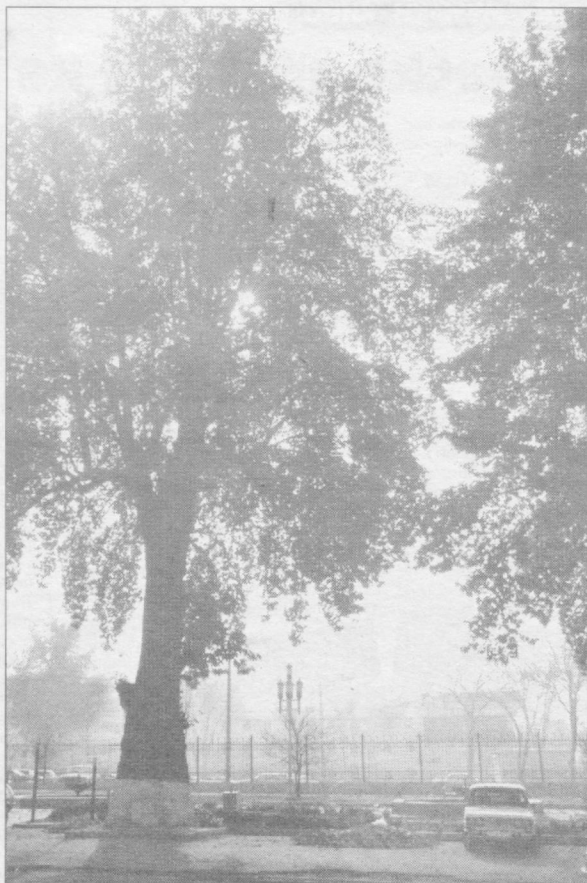
Январь в Ташкенте: то ли зима, то ли осень...