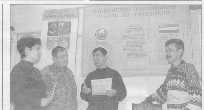
Большое внимание вопросам социальной защиты и создания нормальных условий для работы и отдыха уделяют администрация и профсоюзная организация трамвайно-троллейбусного депо №3. НА СНИМКАХ: члены профкома обсуждают актуальные вопросы своей деятельности; в комнате отдыха во время обеденного перерыва можно почитать свежие газеты и журналы.