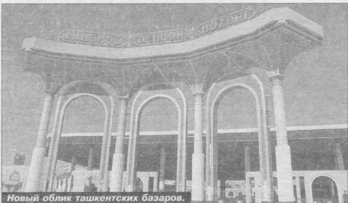
Новый облик ташкентских базаров.