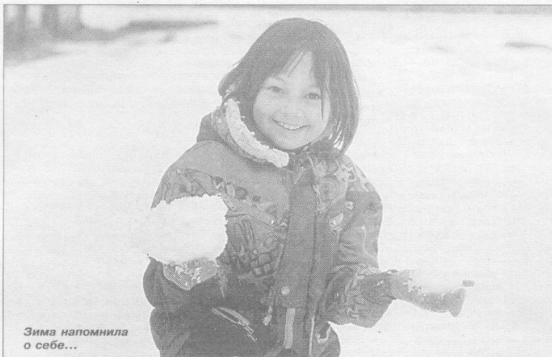
Зима напомнила о себе...