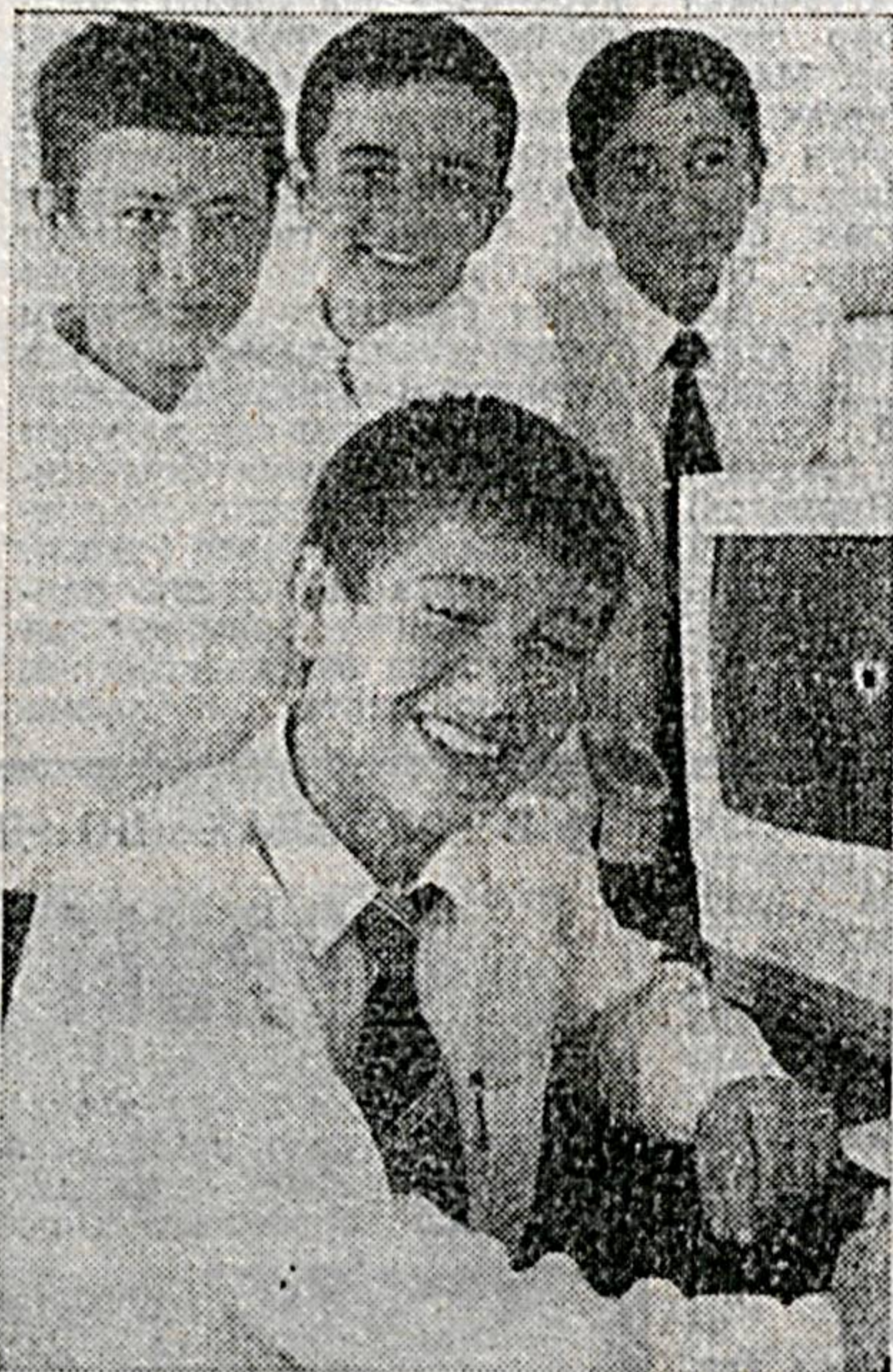
Подготовил Х. МИРЗАЕВ.