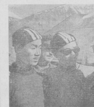
В. РАЦЕК. Заслуженный мастер спорта. На снимке: встреча друзей на Памире.