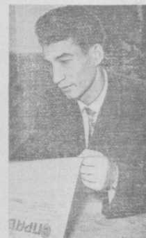
Вот хочется высказать редакции претензии: редко в последнее время печатают фельетоны...