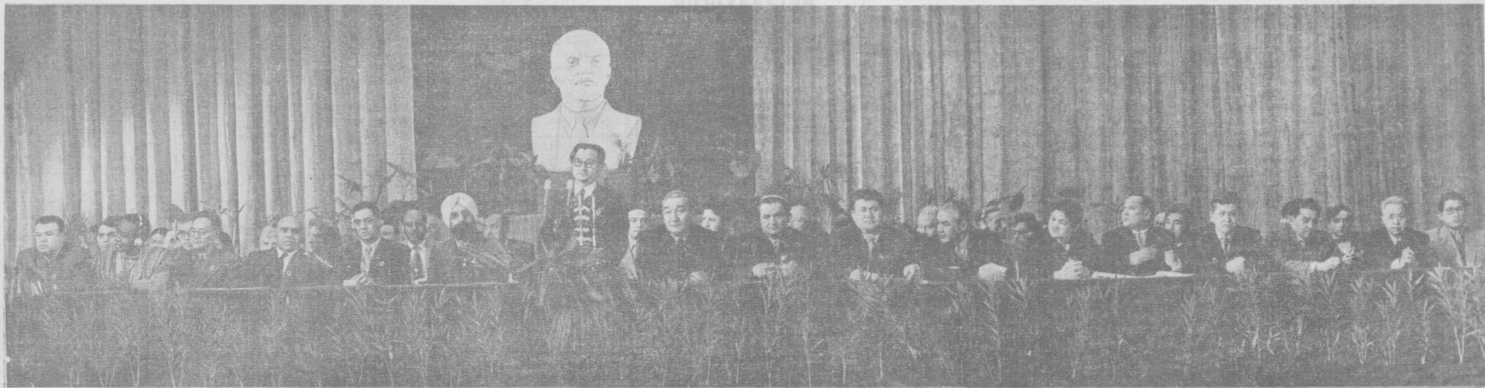
На снимке: президиум IV съезда писателей Узбекистана.