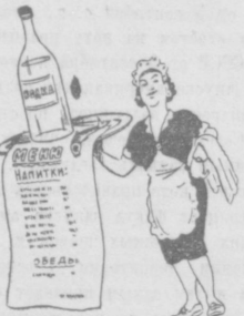
Рис. М. Воробейчикова.

«Для виду преysкурант висит И штепный дразнит аппетит» (Пушкин). Небогат выбор глаголов, которыми обозначают действия пьющих дебоширов. Мало хорошего говорят в этих случаях. Да и вообще — мало говорят. «Кочевряжиться», или там — «фортеля выкидывает». Скупот отзываются. Жители Ферганы ввели в речевой обиход новый глагол этого вида. Если человек лезет купаться в городской фонтан, устраивается сосунуть на проезжей части улицы или пытается оборудовать качели с помощью фонарного столба и соседних подтяжек, ферганцы сумрачно усмеваются: — Готов, родимый. Ишь — преysкуражится! Каково словечко? А пошло оно вот откуда.