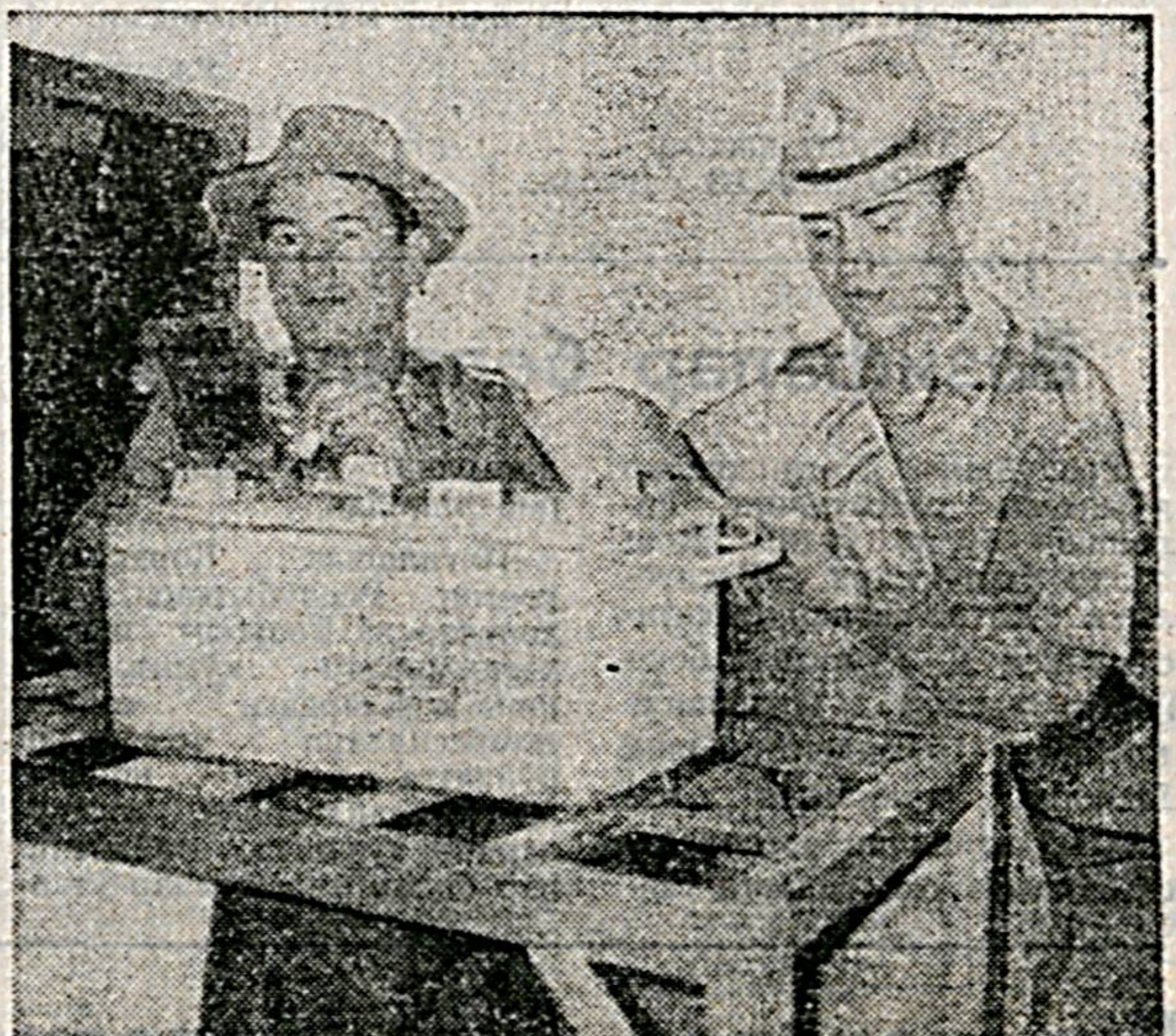
та электролит, шаронт ҳам етарли.

Масалан, ижтимоий-сиёсий ва саф тайёргарлиги бўйича ўтказилган синов машгулотлари бўйича ҳам улар «аъло» ва «яхши» баҳолар олишга мушарраф бўлишиб, жамоа ютуғига ўзларининг сезиларли ҳиссаларини қўшишди. Олдинда ҳали яна синовлар бор. Ишонч билан айтиш мумкин-ки, Хайрулло ҳам, Олланазар ҳам коман-