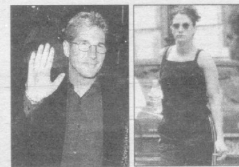
Ричард Гир и Джулия Робертс.

Лучшей парой фильма жанра «action» признана Харрисон Форд и Шон Коннери в картине «Индиана Джонс и последний крестовый поход». Стоит отметить, что на пятом месте в этой номинации единственный женский дуэт среди победителей — Джина Дэвис и Сьюзан Сэрэндон в фильме «Тельма и Луиза».