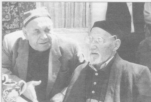
особой заботе и внимании, были вручены подарки от республи-