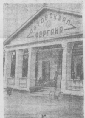
В Фергане недавно открылся новый автовокзал. На снимке: вход в здание автовокзала.