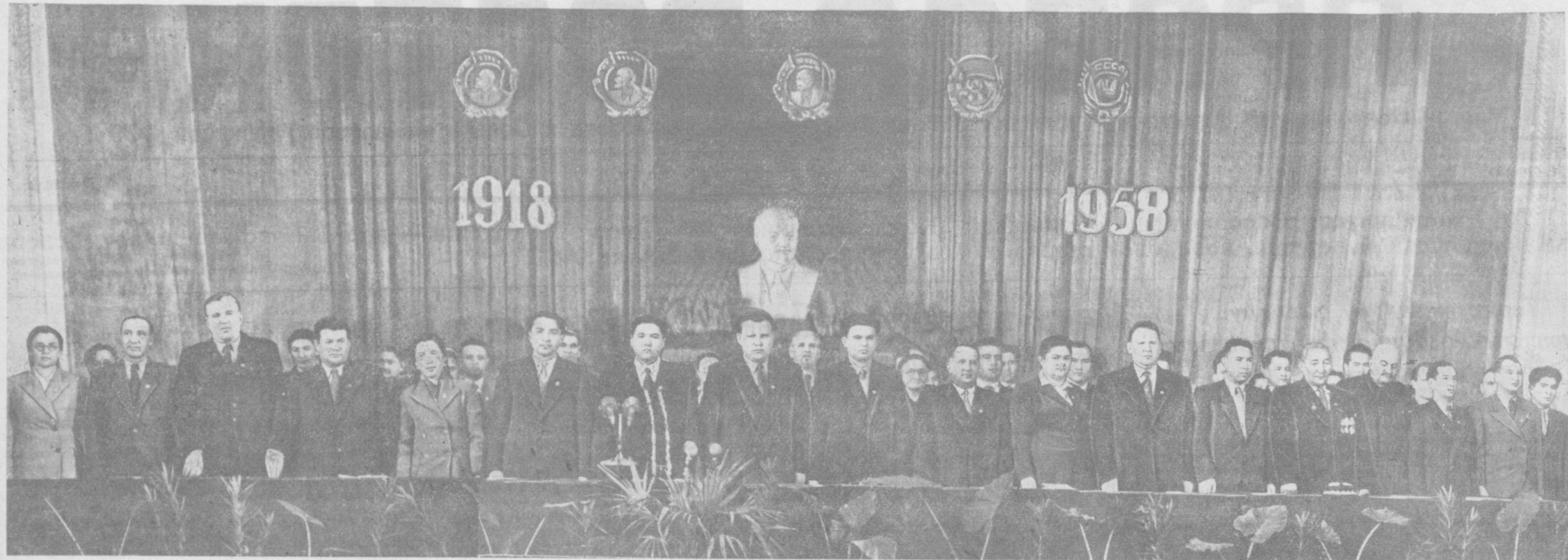
На снимке: президиум торжественного пленума Центрального Комитета, Ташкентского областного и городского комитетов ЛКСМ Узбекистана, посвященного 40-летию ВЛКСМ.