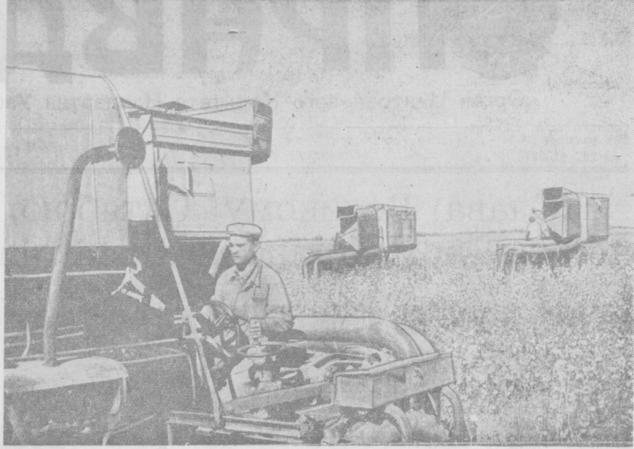
Машинный сбор хлопка в совхозе имени Пятилетия Узбекской ССР.