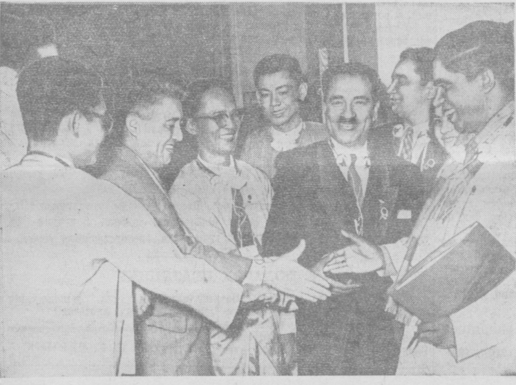
В дни Ташкентской конференции писателей стран Азии и Африки. На снимке: группа делегатов конференции.

Колхоз имени Жаланова, Ахунбабаевского района, Ферганской области.