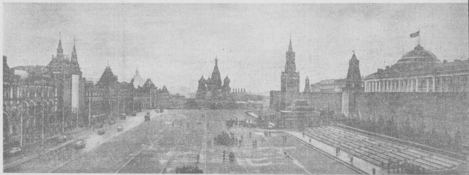
Москва. Красная площадь.

Под знаменем марксизма-ленинизма, под руководством Коммунистической партии — вперед, к победе коммунизма!