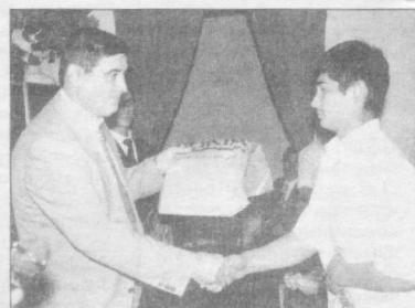
чил новые парты, столы и стулья, различные школьные принадлежности на один миллион сумов.