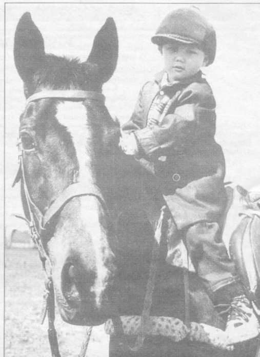
«Куда ковбоям до меня...»