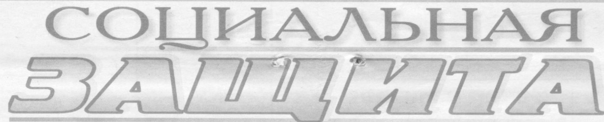
Страница Ташкентского городского совета профессиональных союзов

В нашей подборке мы не раз подчеркивали важность коллективного договора, заключаемого между администрациями предприятий, организаций и профсоюзными комитетами, как полномочными представителями трудовых коллективов. Колдоговоры регулируют практически все вопросы взаимоотношений между работодателями и трудящимися.