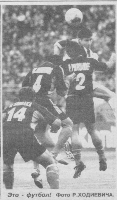
Это - футбол!