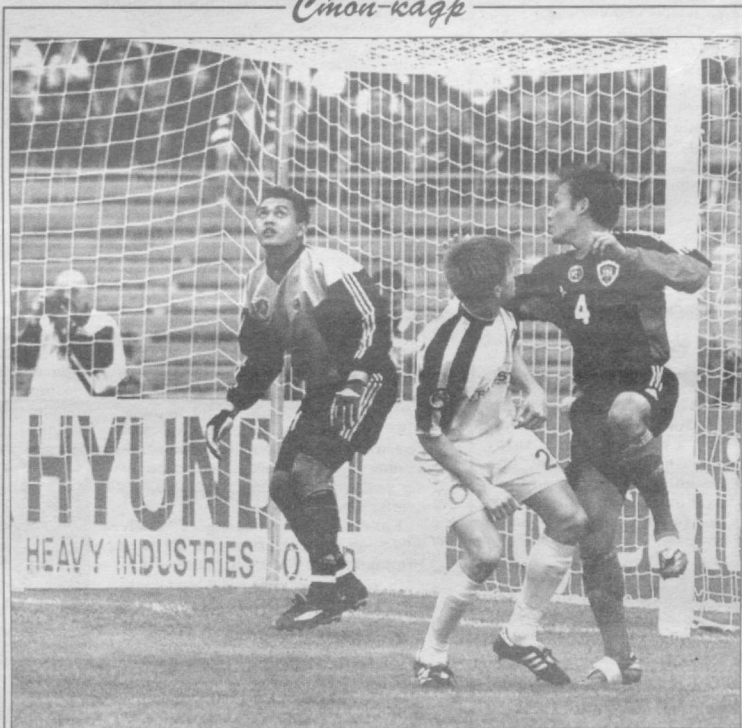
«А мяч-то где?».