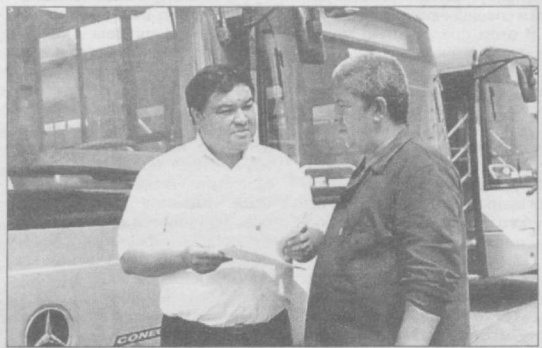
• ТРАНСПОРТ: ЧАС «ПИК»

Необходимо отметить, что после испытания первых двух автобусов этой фирмы на пассажирских маршрутах в Таш-