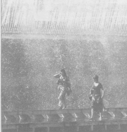
«Приступаем к водным процедурам...»

«Конечно же, мы весьма серьезно отнеслись к ситуации. Наши клиенты и безопасность наших закусок, особенно безопасность пищи, — это вопросы первоочередного значения для нас», — заявил пресс-секретарь компании.