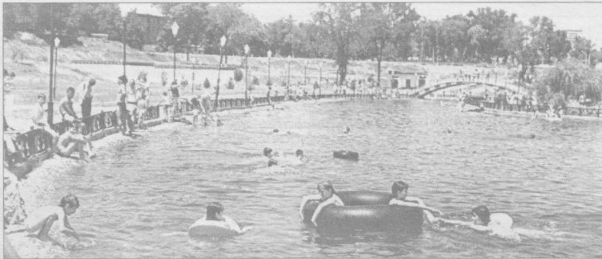
Хорошо в жаркий день искупаться в прохладной воде!

Вместе с тем специалисты считают конфликт далеко не исчерпанным. Судебное решение можно будет оспорить, доказав, что лишние кота свобода нарушает привычный образ жизни и создает для него невыносимые условия. Кроме того, активисты многочисленных обществ защиты животных уже заявили, что не дадут животное в обиду.