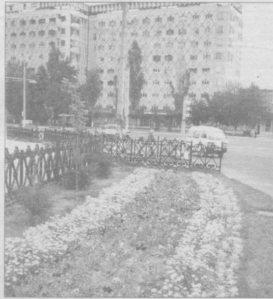
Благоустроенные улицы, оформленные зелеными газонами проспекты радуют глаз.