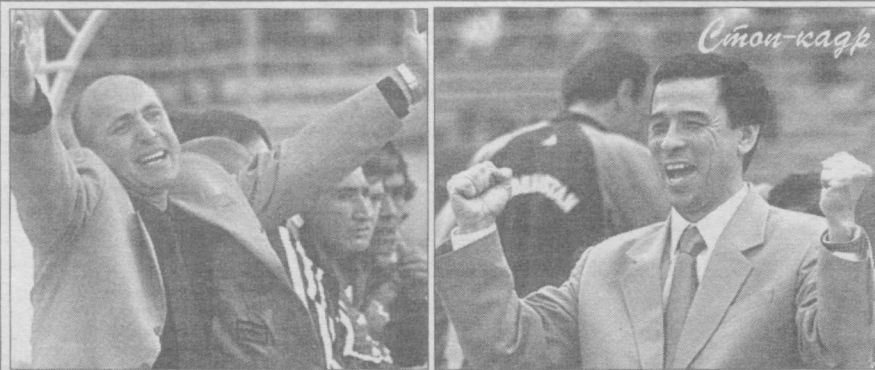
Боль поражения и радость победы.

Набрав 15 очков, канандцы теперь делят 13-14-е места с бекабадским «Металлургом». А их бывшую позицию аутсайдеров занял ташкентский «Трактор», у которого 13 очков. На 1 очко больше в активе другого претендента на вылет из высшей лиги — команды «Гулистан».