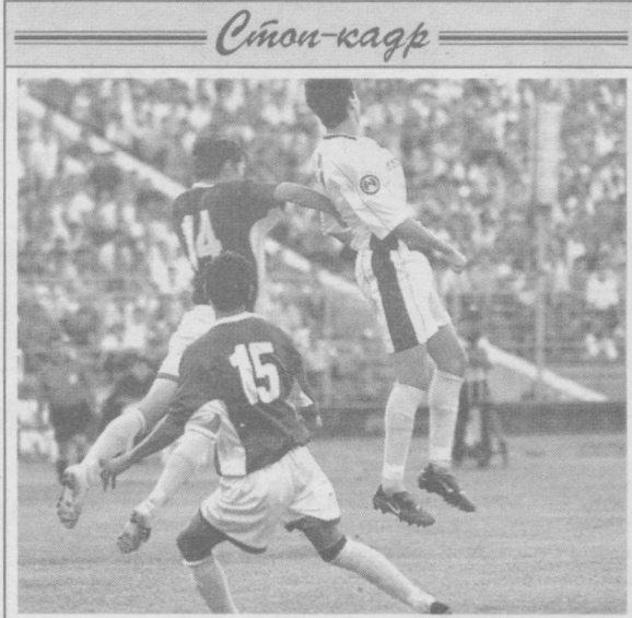
В футболе — все возможно.