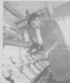
же 50 тысяч газоизмерительных приборов.

В текущем году коллективом предприятия произведено так-