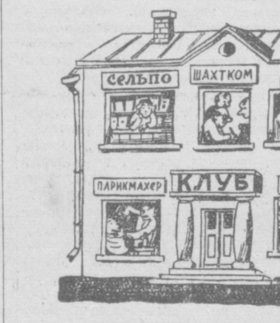
Рис. М. Воробейчикова.

Факиры умеют моментально преградить явию в курицу, проглотить огонь, шпату. Но в мире до сих пор не было ни одного факира, который мог бы проглотить целый клуб из двенадцати комат. А вот в шахтерском поселке Такчиян Сурхандарьинской области такие специалисты нашлись.