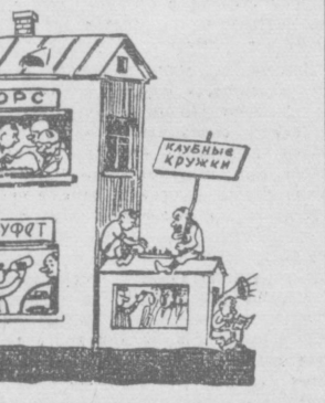
Рис. М. Воробейчикова.

Обо всем этом не знает, очевидно, Сурхандарьинский облсвопроф, который все шлет директивам, требования, предложения об улучшении деятельности кружков художественной самодеятельности.