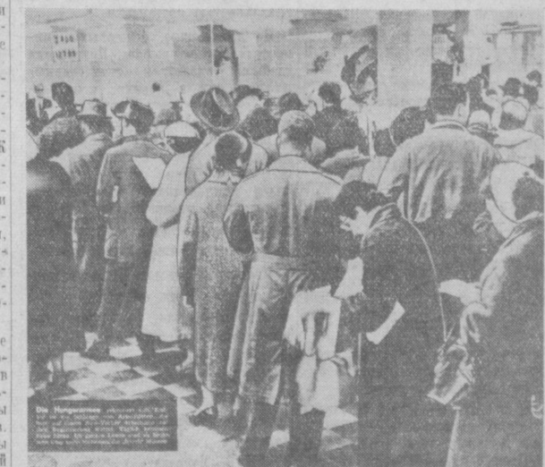
США. Очередь безработных в ожидании регистрации на бирже труда в Нью-Йорке.

◆ ПАРИЖ. В результате второго тура голосования председателем Национального собрания Франции избран депутат от партии ЮНР Шабан-Дельмас. (ТАСС).