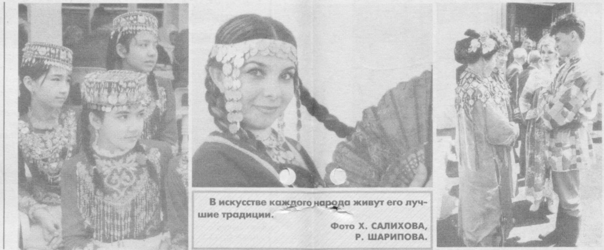
В искусстве каждого народа живут его лучшие традиции.