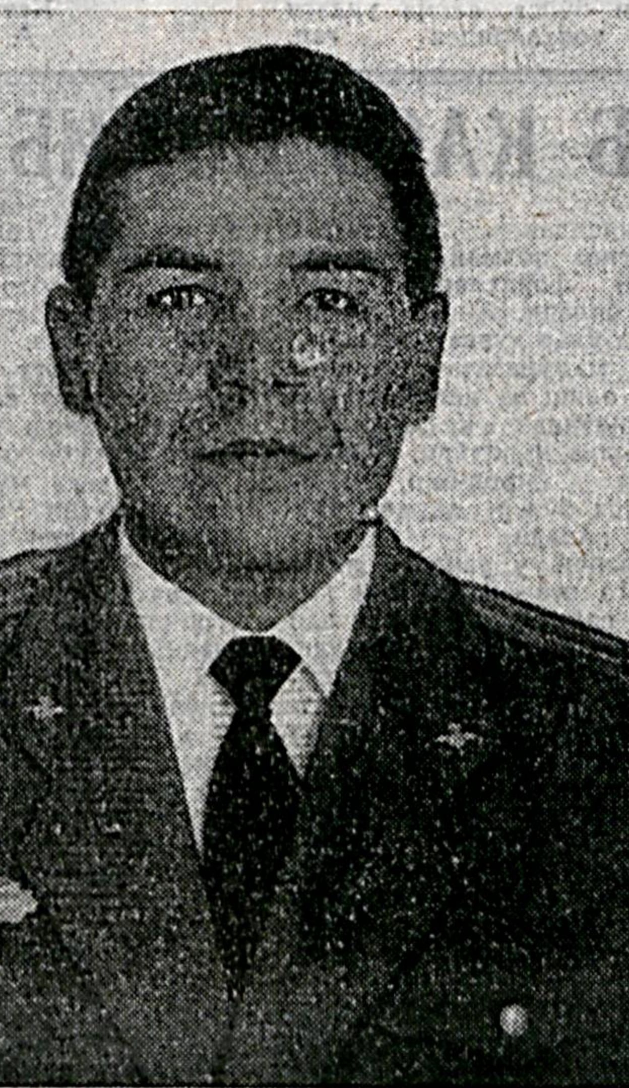
новое назначение — по- мандиром мотострелкового батальона. Да еще на жо- вых, самых непокойных ру- бегах молодого независи- мого государства. Пройдет