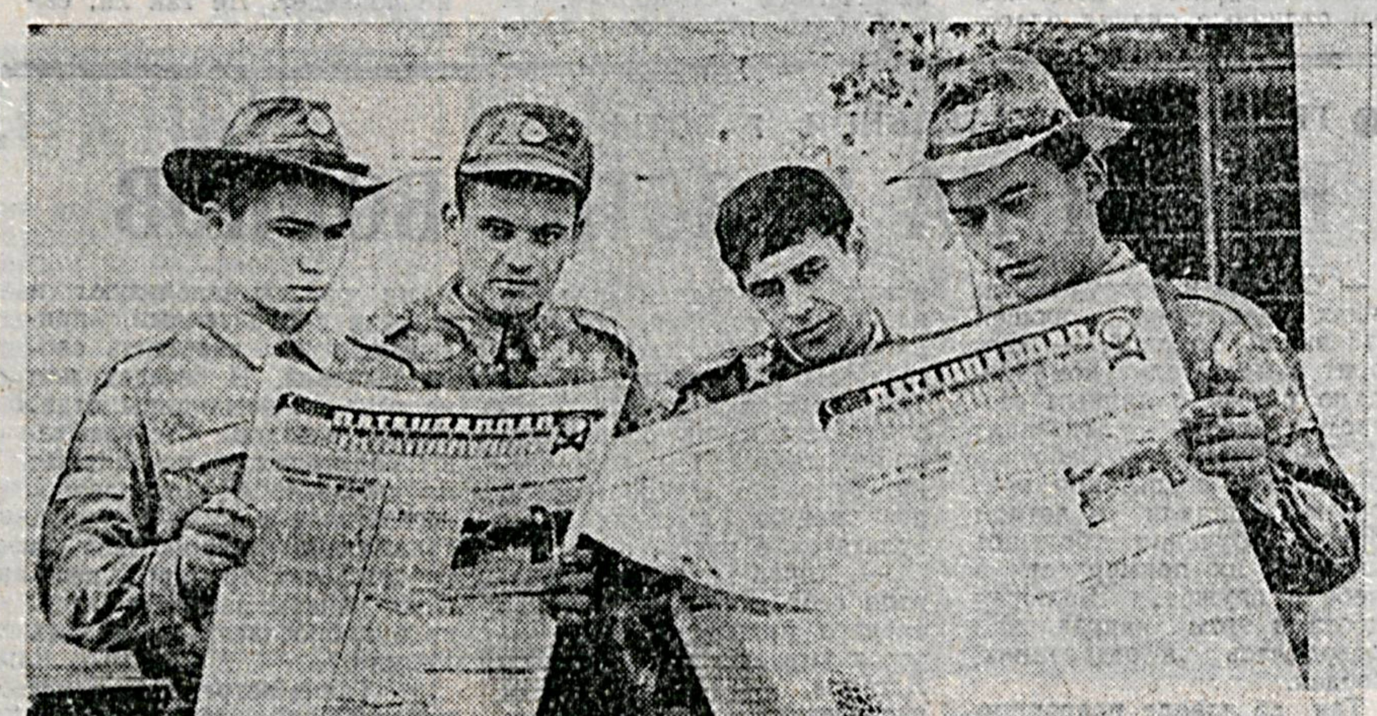
Биринчи аскар: — «Ватанпарвар»нинг лиги сонини қийиб. Иккинчи аскар: — Қанл бу ўқиб кўрайлик-чи, нима- ларини ёзишдан экан. Училичи аскар:

— Мечга тўртинчи саҳифаси маъжуд келди. Шерлар, ҳикоялар, бошқотирма... Тўртинчи аскар: — Аввал иккинчи саҳифани ўқисангиз- чи, бизнинг бўлима ҳақида ёзишган.