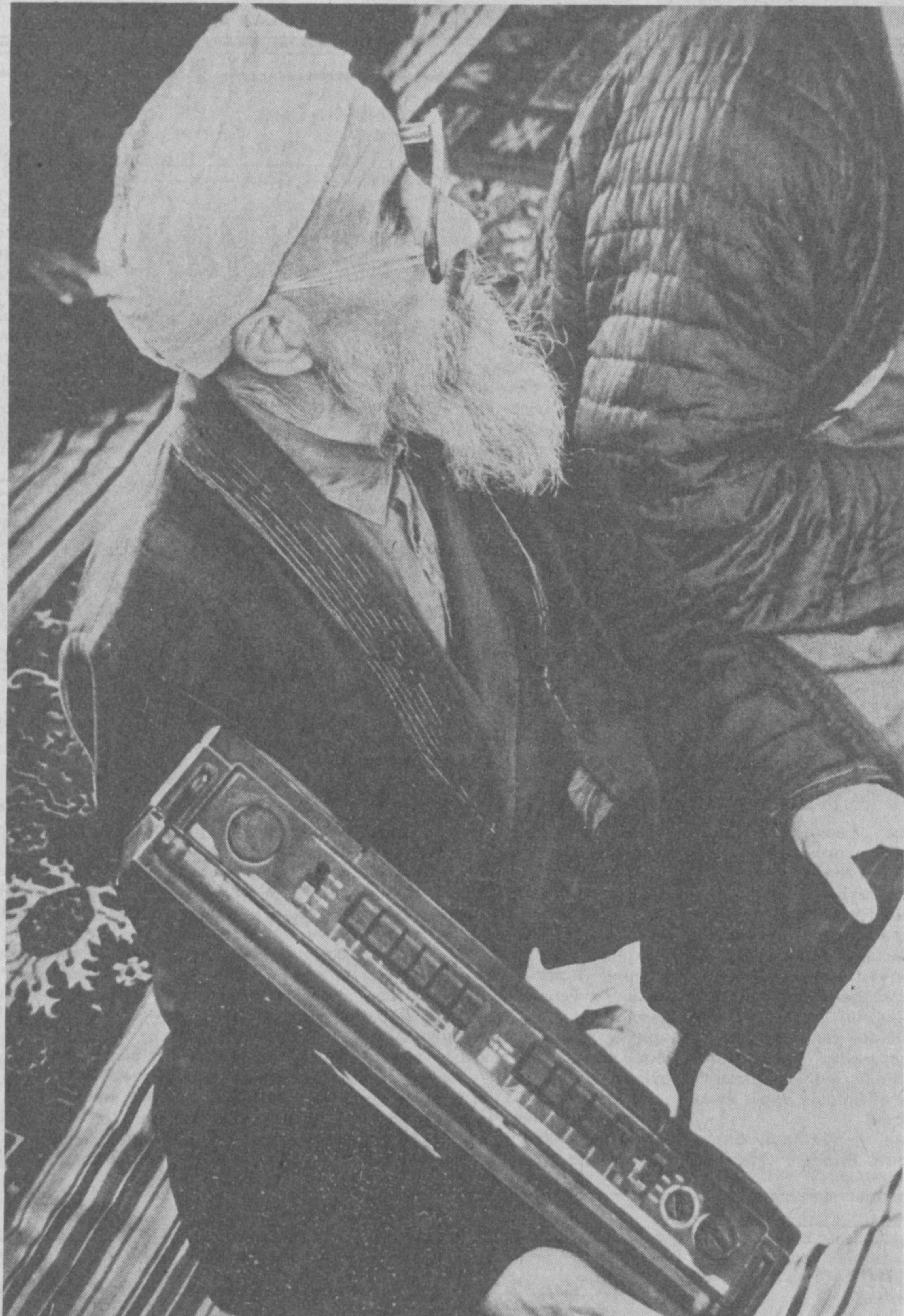
«Оқ қандай ажойиб куй экан...»