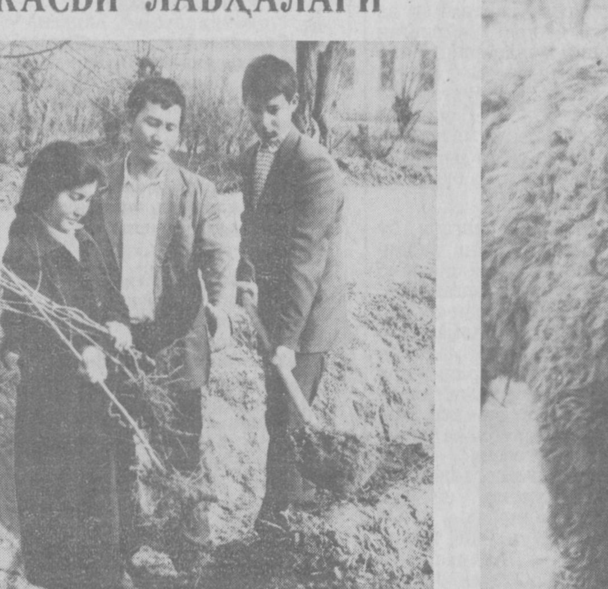
буғунги баҳор нафаси сезилиб турибди. Касби туманидаги Низомий номли ўрта мактабда бу йил 150 та менали ва манзарали дарахт кўчатлари экилди...