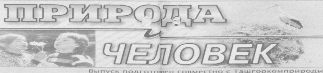
Выпуск подготовлен совместно с Ташгоркомприроды