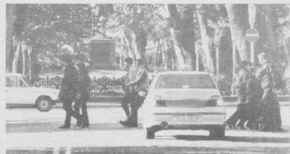
Беседавала Ольга САВЕЛЬЕВА.

В принципе, имея представление, с какой стороны обходить автобус (сзади) или трамвай (спереди), наши люди как будто назвали самим себе делают это с точностью до наоборот. Что же касается светофора: на красный свет — стой, на зеленый — иди, эти элементарные правила,